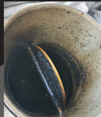
PRIMA DEL TRATTAMENTO