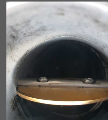
DOPO IL TRATTAMENTO